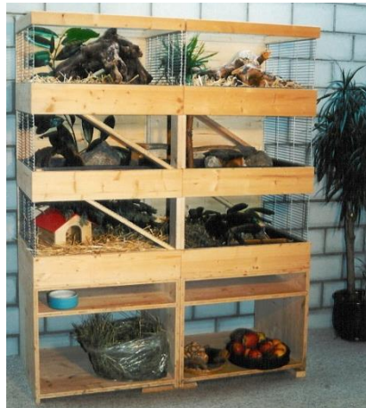
Meerschweinchen-Villa für 2-3 Meerschweinchen oder 5 Ratten 128 x 54 cm Höhe 160 cm Totale Fläche: 2,2 m 2