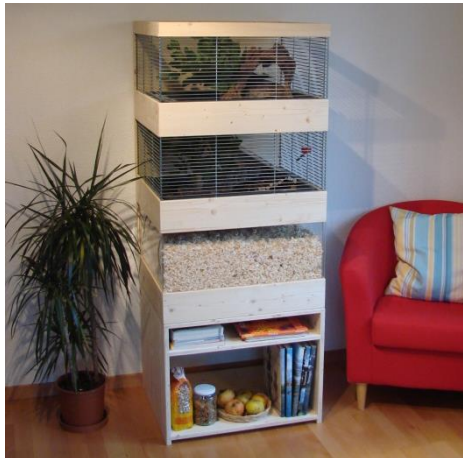
Hamster-Villa mit Wühlkiste für einen Goldhamster oder 2-3 Zwerghamster 64 x 54 cm Höhe 160 cm Totale Fläche: 1,1 m 2

Die Kleintiervilla beweist, dass ein Gehege in der Wohnung auch bei kleinen Abmessungen viel Platz für Tiere bietet und zudem praktisch und schön sein kann. Das mehrstöckige Gehege verschafft den Tieren zusätzlich abwechslungsreiche Klettermöglichkeiten und bietet Ihren Tieren naturnahen und artgerechten Lebensraum.